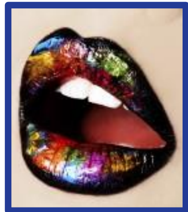
Produção Final dos Alunos