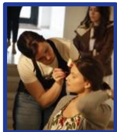
Ambiente de Curso