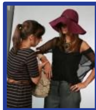
Ambiente de Curso