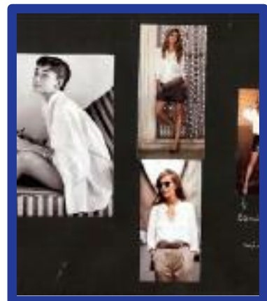
Trabalho dos Alunos