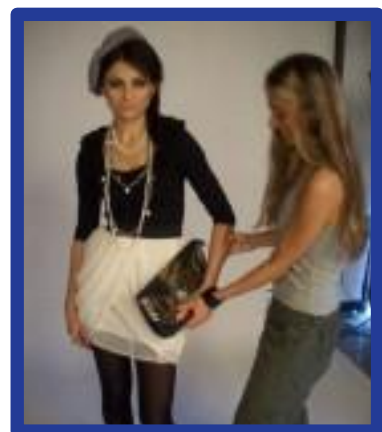
Ambiente de Curso