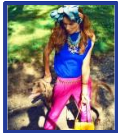
Produção Final dos Alunos

O curso tem como objectivo formar profissionais qualificados na área da Consultoria de Imagem que consigam tornar-se consultores de imagem e aconselhamento, respondendo de acordo com as tendências da altura, mas tendo em conta os aspectos e valores individuais de cada potencial cliente.